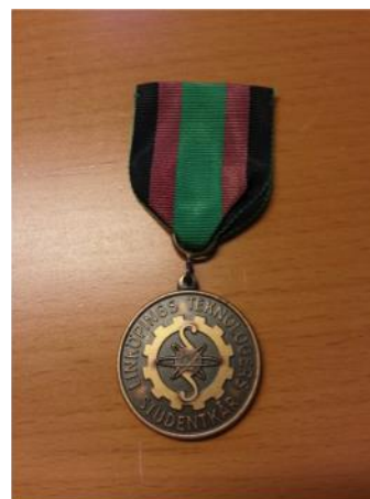
Bild 3. LinTeks bronsmedalj

LinTeks inspektor innehar en inspektorsmedalj som går i arv från inspektor till inspektor. På baksidan av medaljen inristas inspektors namn.