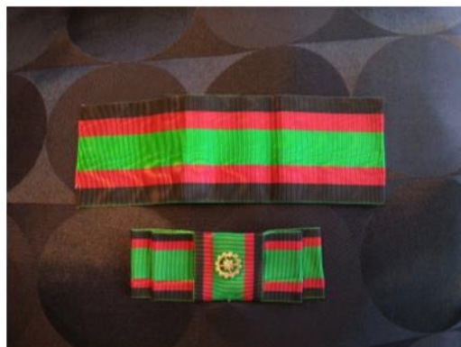
Bild 2. LinTeks kårband

Brett kårband och kårband knutet som rosett kan också berättigas annan engagerad inom LinTek enligt särskilt motiverat beslut i LinTeks kärfullmäktige.